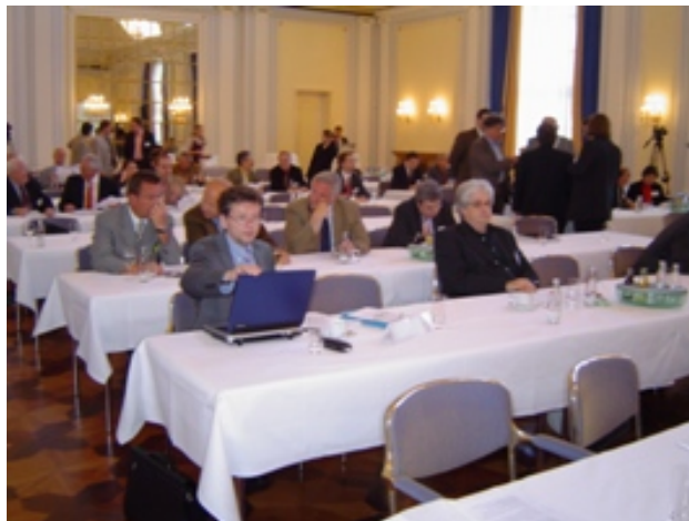
Vortrag: Akzeptanz regionaler Fernsehveranstalter im nördlichen Rheinland-Pfalz