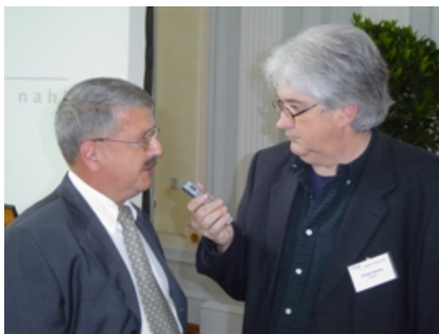
Vortrag: Akzeptanz von lokalem und regionalem Fernsehen in Sachsen